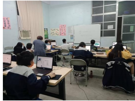
110-1 線上伴讀開課，螢幕兩端的大小學伴都很認真的跟另一頭夥伴上課、交流！