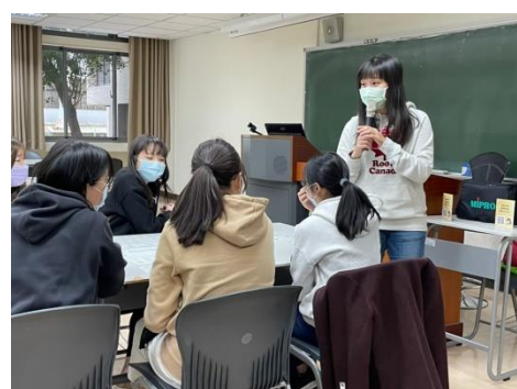
月培訓（一）風險知多少：和元大文教基金會合作，為大學生建立基礎理財觀念。