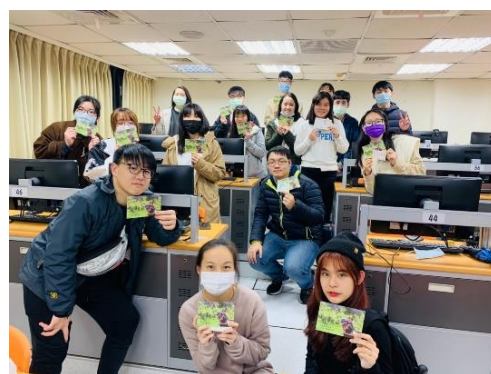
線上伴讀結業式，感謝大家這一學期的參與 及對小學伴的教學與陪伴。