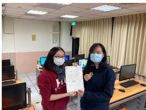
頒發優良大學伴獎狀，感謝大學伴這一學期 為線上伴讀的付出。