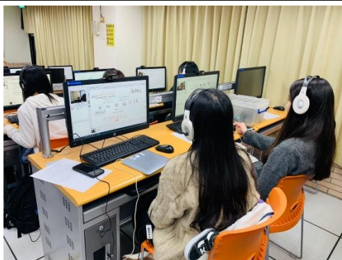
大學伴於電腦教室透過網路進行線上伴讀， 陪伴偏鄉學童課業上的輔導。