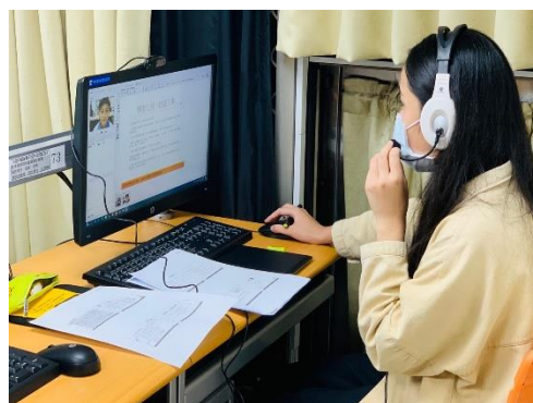
大學伴於電腦教室透過網路進行線上伴讀， 陪伴偏鄉學童課業上的輔導。