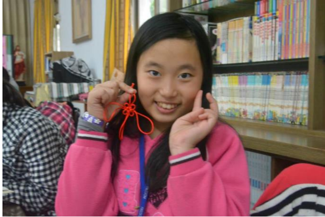
綜合活動課-吉祥結